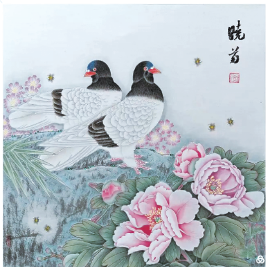
牡丹双鸽·富贵和鸣