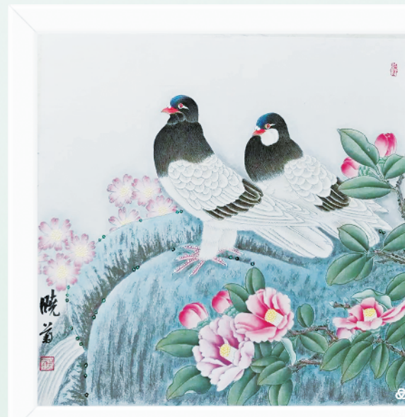
丹青春色·双禽凝香