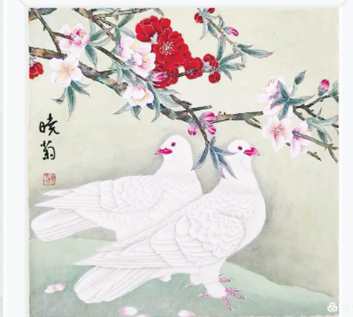
桃花映雪·白鸽栖石