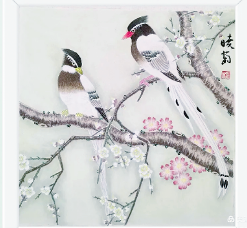
梅梢春信·回首顾盼