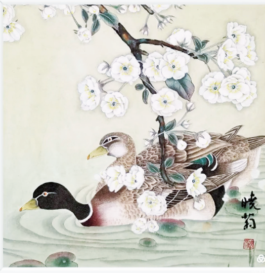
梨花风起·鸭戏清波