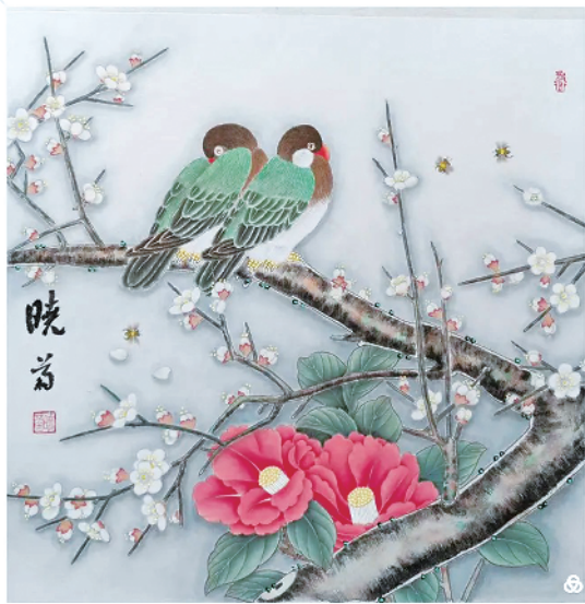
喜上眉梢·梅花双鸣