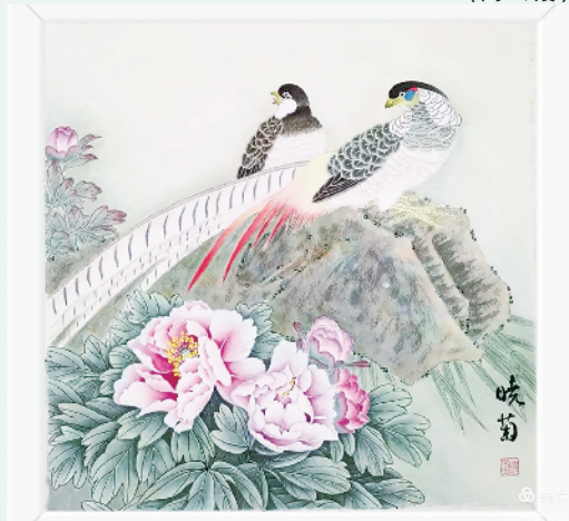
锦羽衔春·富贵长春