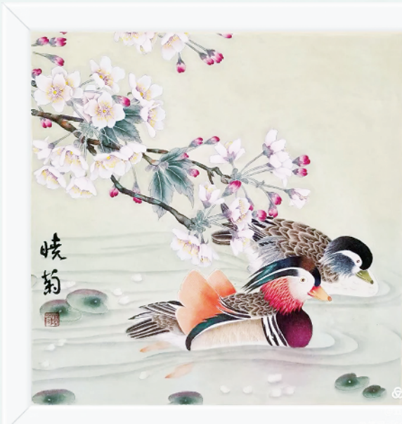
海棠醉春·鸳鸯戏水