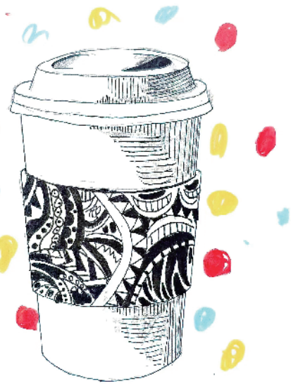
六(1)班 郑羽霏 辅导老师:陈怜佳