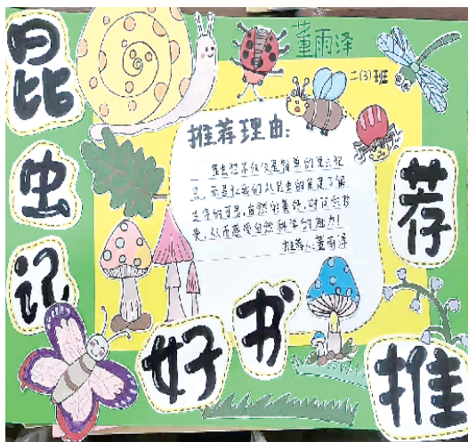
二(3)班 董雨泽 辅导老师:蒋冰婉