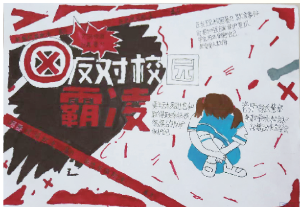
小记者:王东涵 五(4)班 辅导老师:周华磊