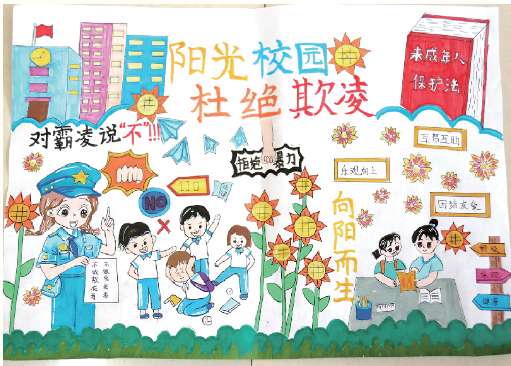
小记者:王瑞鑫 五(4)班 辅导老师:周华磊

凝望着这银装素裹的小区,耳畔回荡着阵阵欢声笑语,我情不自禁地在心中呼喊:啊,我深爱这冬日的雪景!(辅导老师:阮伟)