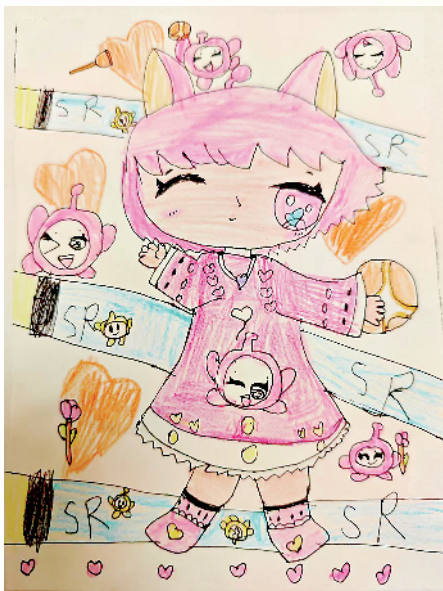
小记者:周■青 二(3)班 辅导老师:石继红