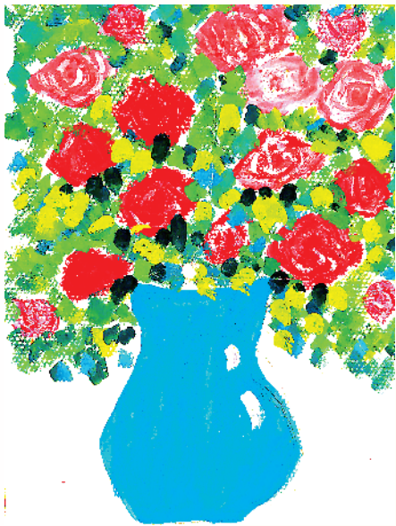
小记者:苏之桃 四(1)班 辅导老师:李萍