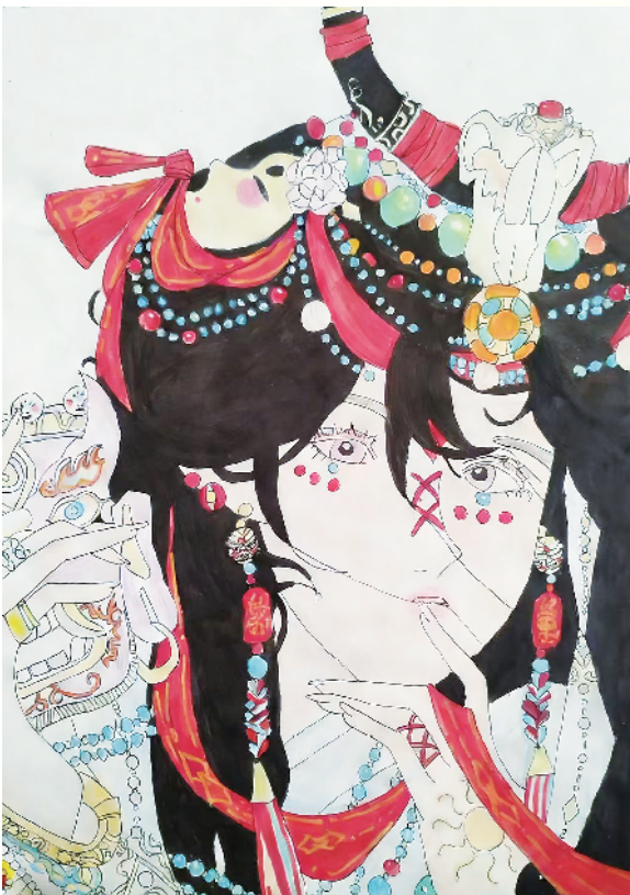
小记者:张家旭 五(7)班 辅导老师:徐吉丰