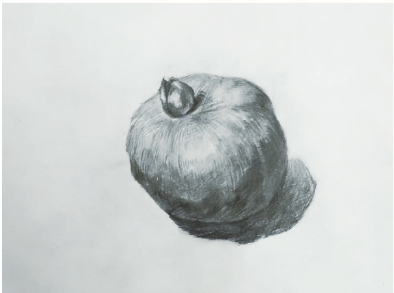
小记者:孙倩 六(7)班 辅导老师:徐吉丰